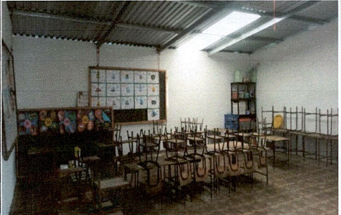
Foto 4: Modulo 1 en la cual se muestra el mejoramiento en la parte interna

Observación: Si es necesario se pueden agregar hojas adicionales y actualizar el número de hojas.